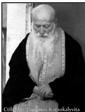
Ctihodný Pafios Kavsokalyvita

Chci, abys pochopil, že není těžkostí, které nemají své řešení v Kristu. Oddej se Kristu a On pro tebe najde řešení. Neboj se těžkostí. Měj je rád, děkuj za ně Bohu. Ony mají nějaký svatý cíl pro tvůj život.