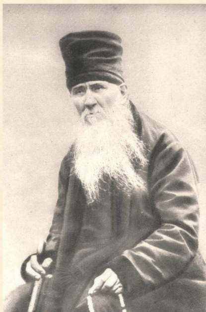
Ctih. Amvrosij Optinský

A takto v průběhu celého dne - cokoliv by se s vámi dělo, vše obraťte na modlitbu.